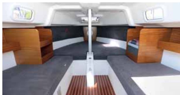
Podpalubí je orientováno na denní plachtění. Jediný nedělený prostor je světlý, prostorný a vyznačuje sportovního ducha.

V základní verzi je Sunbeam 22.1 určen opravdu jen pro denní plachtění. Postrádá jak kuchyňku, tak WC, a kdo chce na něm nejen plachtit, ale také žít, musí jeho vybavení doplnit. Doplnky jsou pak řešeny velmi zajímavým způsobem – v podobě kostek a modulů. Ostatně modulový systém je uplatněn již na zádi lodě. Můžete ji mít s běžným držákem přidavného motoru, nebo se speciálním, na němž se dá motor nejen vytáhnout vzhůru, ale také překlopit a pomocí vestavěných kolejnič zasunout pod levoboční bakistu. Nicméně doménou modulového systému je podpalubí. Skutečnou kostkou je elektrický modul, který obsahuje v jednom celku baterii, přepojovač, zásuvky a kabel pro připojení na elektrický rozvod v marině. Kostka je obložená dřevem a dá se zasunout pod kokpit, ovládacím panelem dopředu. Dalšími moduly, které umožní na lodi komfortněji žít, jsou chemický