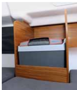
Příplatkový chladicí box