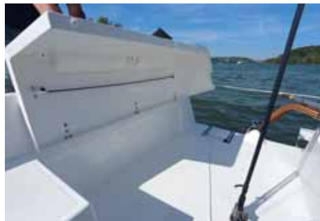
Pod lavice v kokpitu lze uskladnit přívěsný motor nebo třeba fendry.

WC a 25l chladicí box. O kuchyňce však loděnice neuvažuje, to spíše o kávovaru, který je ve výbavě větších Sunbeamů 24 a 28. Jak říká spolukonstruktor a manažér firmy Manfred Schöchl: „Takové lodě se nejčastěji provozují na vnitrozemských vodách, kde člověk potřebuje jenom kóji, aby měl během víkendové regaty nebo plavby s rodinou kde přespat. A maximálně si ráno udělat rychlé kafe.“