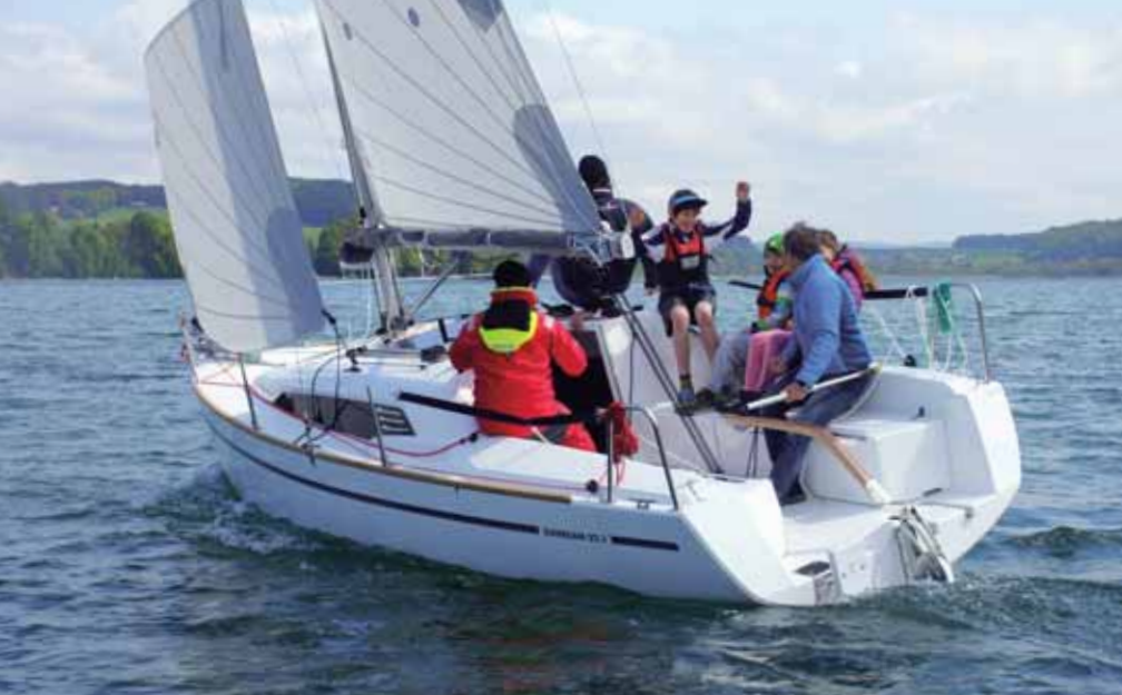
Sunbeam 22.1 je loď pro celou rodinu.

zavíracího nože a při plném vyklopení zasahuje do hloubky 1,4 m. K jejímu zatažení slouží kladkostroj s převodem 4:1 a ponor poté klesne na 0,6 m. Plachetnice tedy může plout ve velmi mělkých vodách a dá se snadno spouštět do vody na běžné rampě. Stabilitu posiluje vnitřní balast (200–270 kg), který se skládá z olovených bloků, jež se ukládají před ploutvovou skříň pod spací plochu. Toto řešení není ideální pro plavbu ve vlnách, ale umožňuje rozložení zátěže při transportu za osobním automobilem. Nízká ploutvová skříň v interiéru téměř nepřekáží. Těž kormidelní list je sklopný a v pracovní poloze jej drží dvě plynové vzpěry. List má bionickou koncepci, neboť jeho odtoková hrana je v dolní části zvlněná a zesílená tak, jak jsou tvarovány ploutve velryb. To snižuje víření za kormidlem a používá se na velkých regatových jachtách (RAMBLER, PRB). K ovládání kormidla slouží esovitě prohnutá kormidelní páka, která je opatřena pínou.